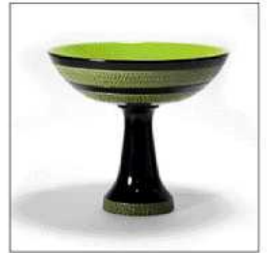
INV-1378 /1961年 サイズ:Φ.240 H.230 税込 ¥ 50,400 (再生産数: 199個)