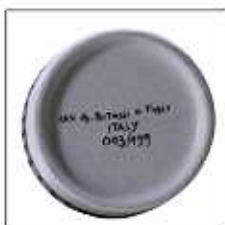
・リミテッドナンバーが底面に入っています。