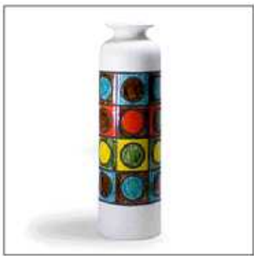
INV-2479 /1963年 サイズ:Φ.150 H.500 税込 ¥ 75,600 (再生産数: 149個)