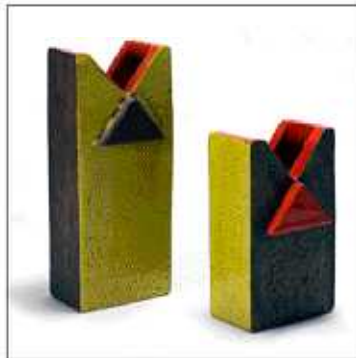
INV-2270/2271 /1967年 サイズ:W.80 D.50 H.210 (2270) :W.80 D.50 H.150 (2271) 税込 ¥ 37,800 (再生産数: 199個)