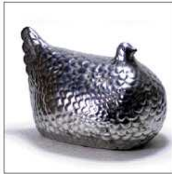
INV-2477/1963年 サイズ:W.220 D.340 H.250 税込 ¥ 61,950 (再生産数: 149個)