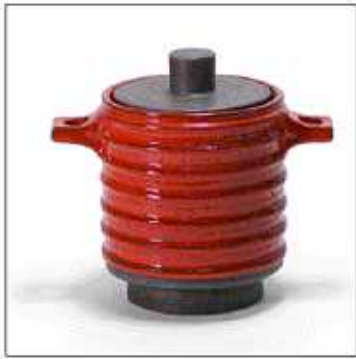
INV-2293 /1960年 サイズ:Φ.190 H.200 税込 ¥ 26,250 (再生産数: 199個)