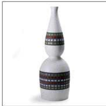
INV-1414 /1958年 サイズ:Φ.150 H.450 税込 ¥ 57,750 (再生産数: 199個)