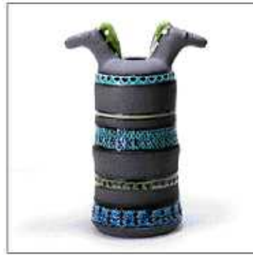
INV-508 /1963年 サイズ:Φ.220 H.360 税込 ¥ 46,200 (再生産数: 199個)