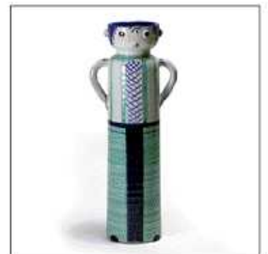
INV-2478 /1964年 サイズ:Φ.130 H.360 税込 ¥ 54,600 (再生産数: 199個)