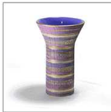
INV-1389/1961年 サイズ:Φ.160 H.250 税込 ¥ 39,900 (再生産数: 199個)