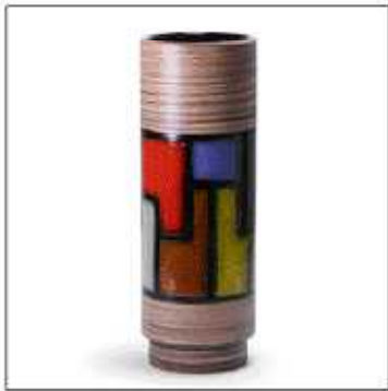
INV-2046 /1966年 サイズ:Φ.120 H.350 税込 ¥ 52,500 (再生産数: 199個)