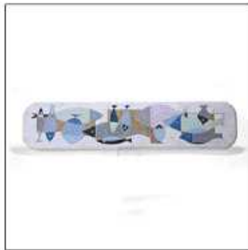
INV-1978 /1959年 サイズ:W.610 H.150 税込 ¥ 73,500 (再生産数: 199個)