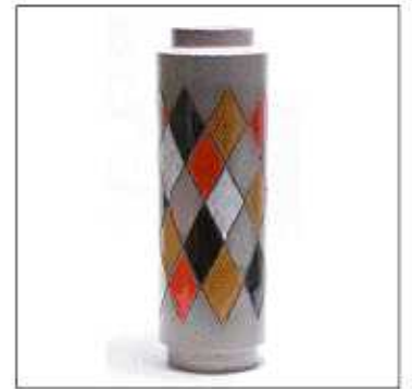
INV-1930 /1961年 サイズ:Φ.150 H.440 税込 ¥ 70,350 (再生産数: 149個)